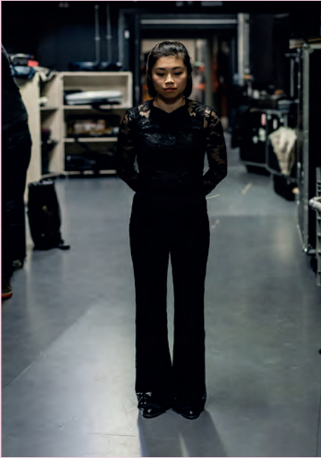
Antwerp Symphony Orchestra & Vincent Collot

Het Antwerp Symphony Orchestra werkte een brede communicatiecampagne uit om de komst van Elim Chan aan te kondigen. Deze campagne bleef niet onopgemerkt en kreeg ook in de pers veel navolging.