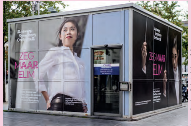
Antwerp Symphony Orchestra & Vincent Collot

Het Antwerp Symphony Orchestra werkte een brede communicatiecampagne uit om de komst van Elim Chan aan te kondigen. Deze campagne bleef niet onopgemerkt en kreeg ook in de pers veel navolging.