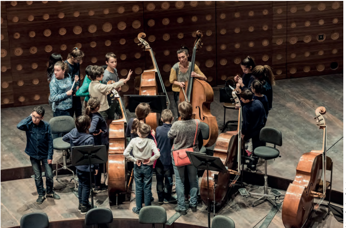
Antwerp Symphony Orchestra