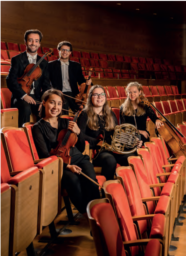
Antwerp Symphony Orchestra & Vincent Collet

In de eerste helft van 2019 namen 6 jonge muzikanten deel aan de Academy. Een aantal van hen kreeg ook de kans om mee te gaan op tournee naar Zuid-Amerika. In het najaar van 2019 werden 7 nieuwe muzikanten toegelaten tot de Antwerp Symphony Orchestra Academy.