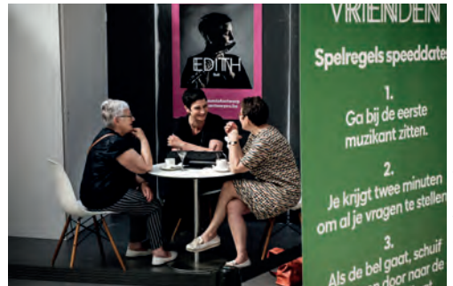
Antwerp Symphony Orchestra