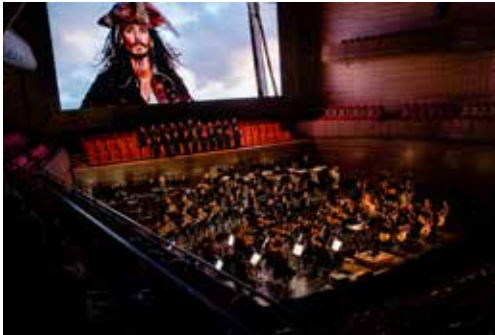
AntwerpSymphony & Vincent Callet

Tijdens de filmconcerten brengt Antwerp Symphony live de soundtrack bij bekende blockbusters, om zo een grootse, symfonische ervaring te creëren. In 2022 lokten 'The Lord of the Rings: The Fellowship of the Ring' en 'Pirates of the Caribbean: the Curse of the Black Pearl' bijna 6.000 film- en muziekliefhebbers naar de Koningin Elisabethzaal.