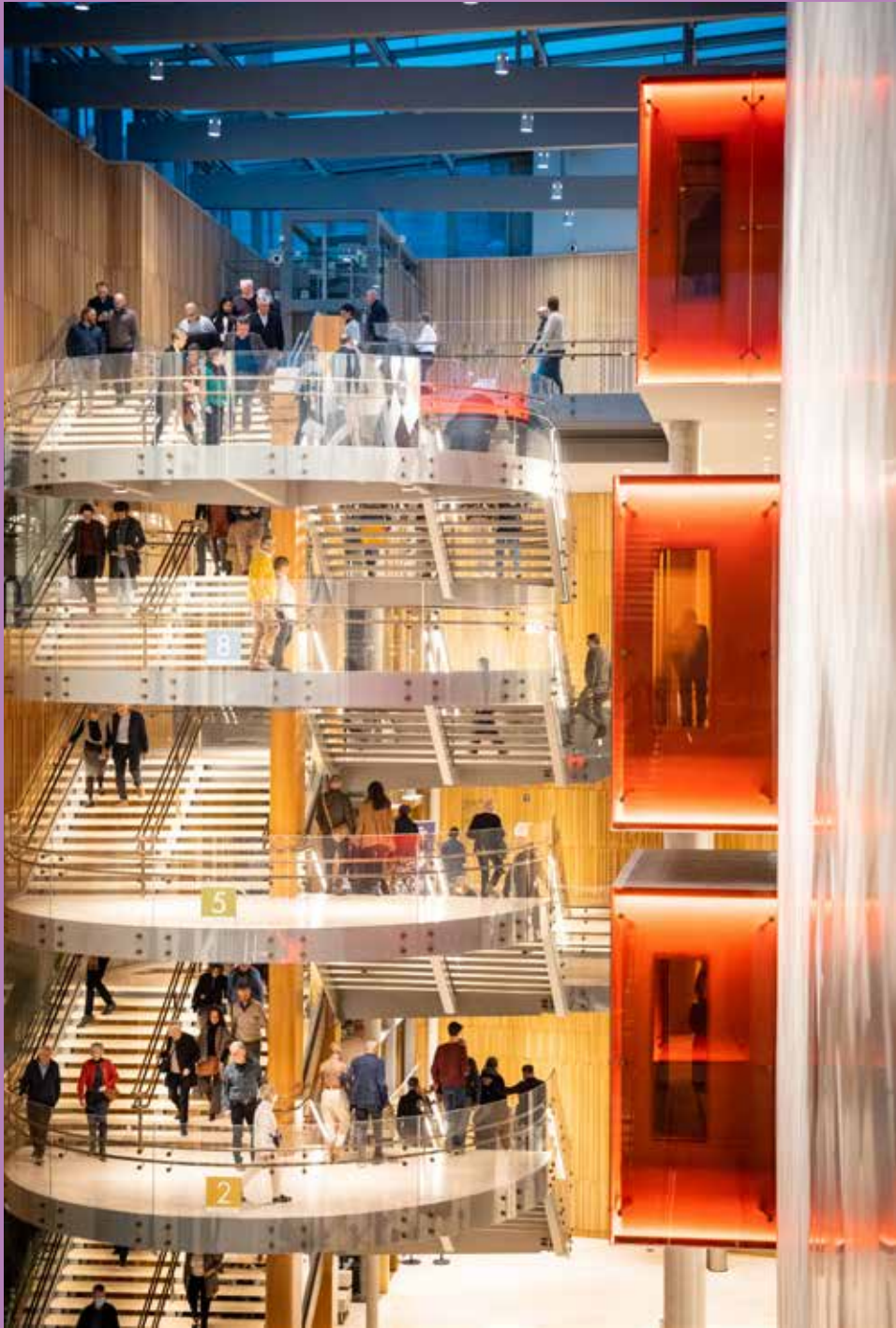
Antwerp Symphony Orchestra & Björn Comhaire

Publicatiedatum april 2023 – Vormgeving: Coast Agency Vertaling: Géraldine Lonnoy, François Delporte & Sandy Logan VU: Joost Maegerman, Carnotstraat 10, 2060 Antwerpen