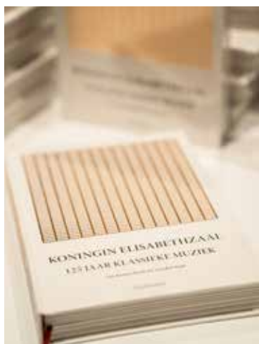
Antwerp Symphony & Vincent Gallot

Gerennomeerde experts, zoals cultuurhistorica Hedwige Baeck-Schilders en muziekwetenschapper Jan Dewilde, leverden tekstbijdragen op basis van eigen onderzoek. Fotograaf Michiel Hendryckx liet zich inspireren en portretteerde in zijn geheel eigen stijl enkele significante plaatsen uit de royale geschiedenis van de Koningin Elisabethzaal.