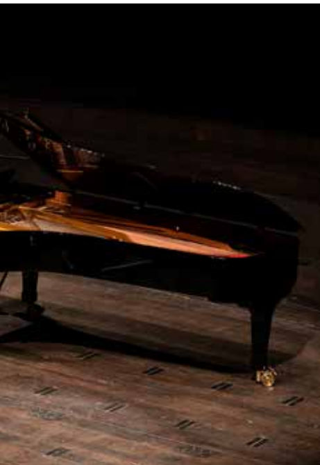
Antwerp Symphony, Korean Cultural Center Brussels & Frank Emmers

In 2022 werd onder andere een Duitse paukense van Hartke aangekocht.